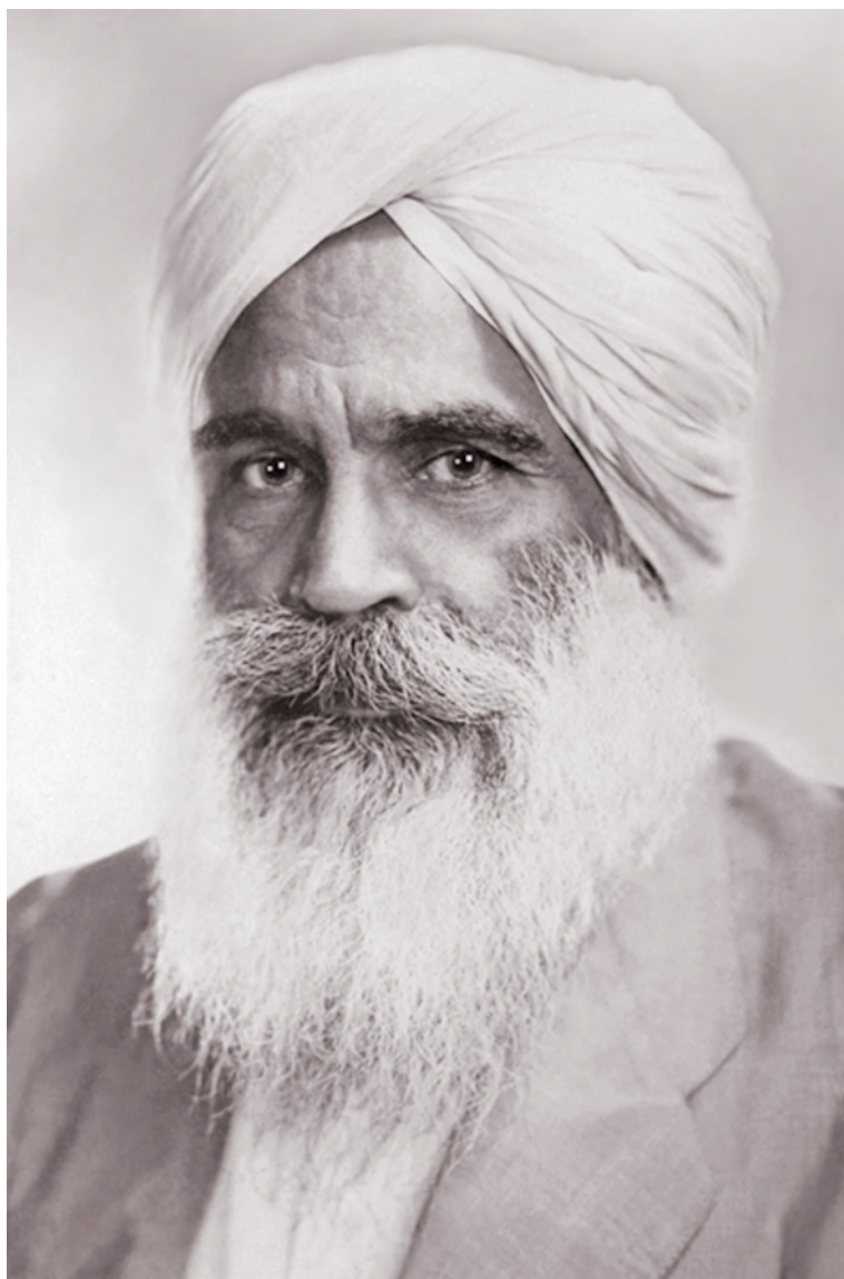
聖基爾帕辛吉(1894年-1974年)